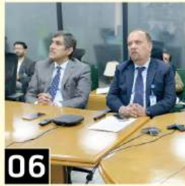
06 MD SNGPL reviewed the arrangements to ensure uninterrupted gas supply during the month of Ramzan