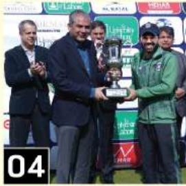
04 SNGPL Finishes Runner-Up in President's Cricket Trophy 2025 - 26