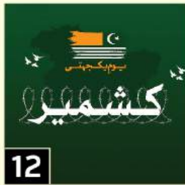
12 یوم کشمیر