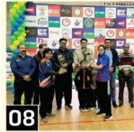
08 Sui Northern excels in the sports arena