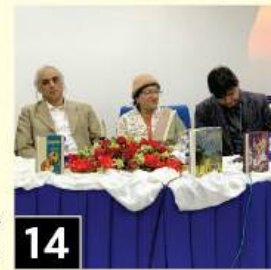
14 پنجابی ناول نگاروں پر ادبی نشست