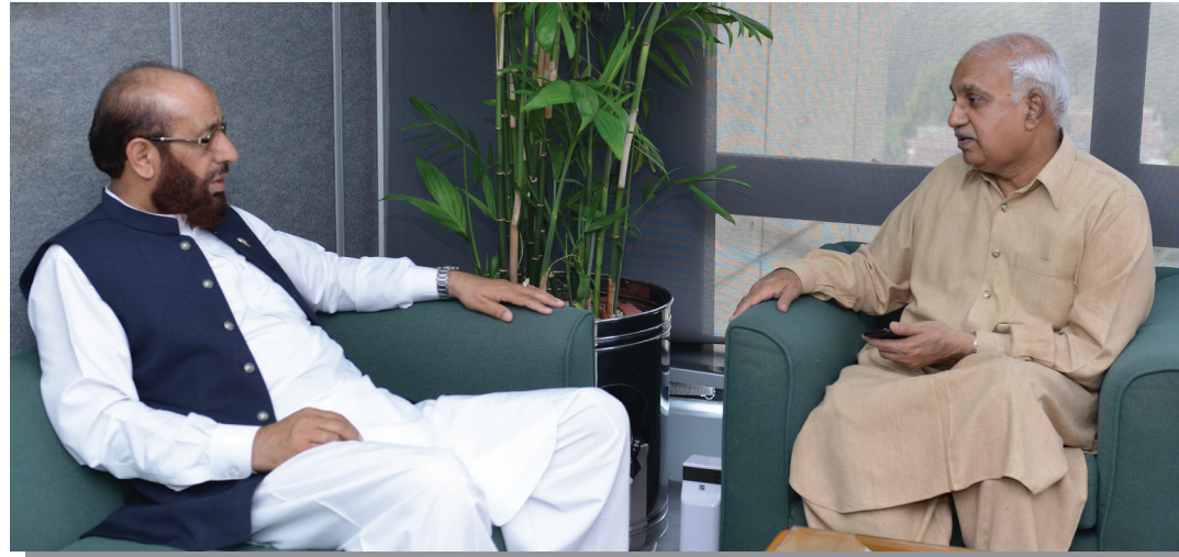
► Federal Minister for Religious Affairs Sardar Mohammad Yousaf called on MD SNGPL Amjad Latif.