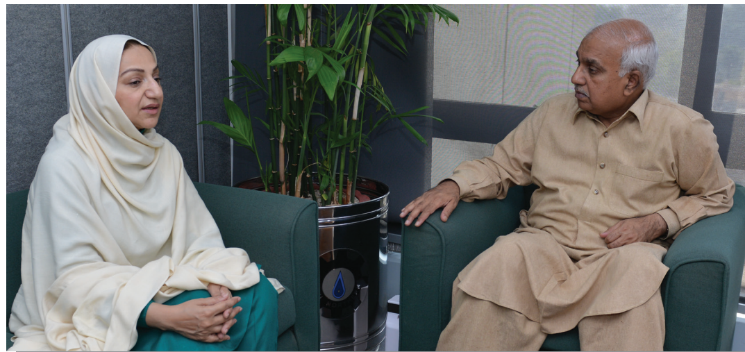
► Federal Minister for National Health Services Regulation and Coordination Saira Afzal Tarar met with MD SNGPL at Head Office.