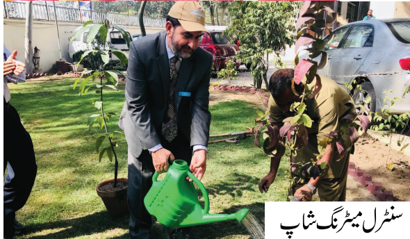
سنٹرل میٹرنگ شاپ