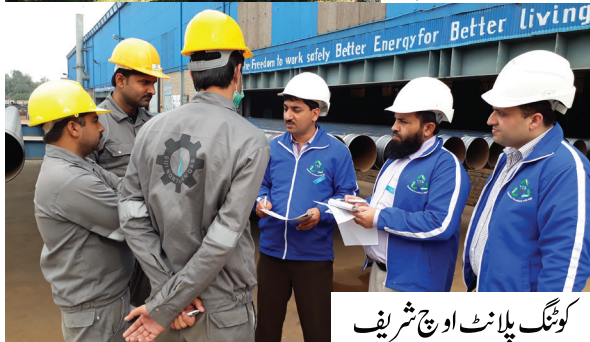
کوئٹہ پلانٹ اونچ شریف