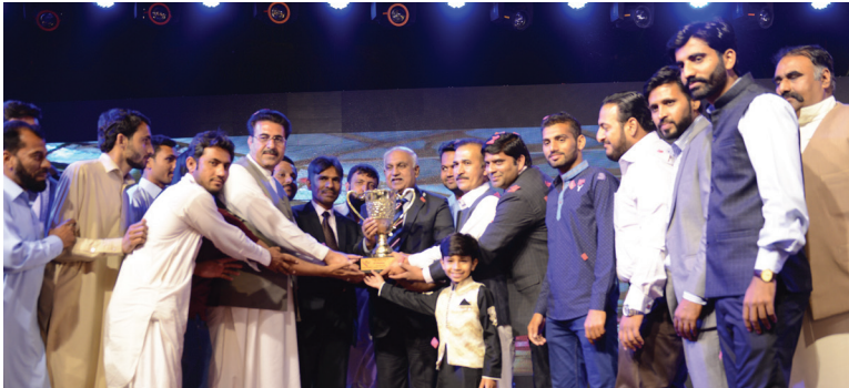
► Head Office and Islamabad sharing the trophy for third position.