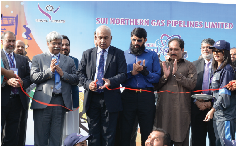
► More pictures on page 16