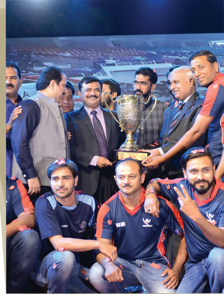
Annual Sports Gala Lahore (D) Titled the Champion