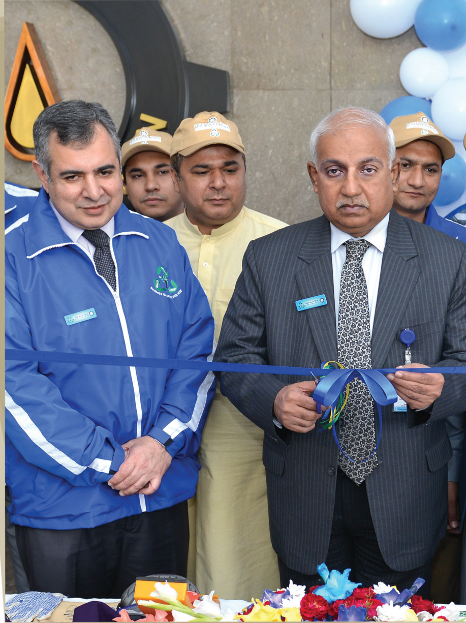
ہفتہ ایچ ایس ای کام کے محفوظ اور صحت مندانہ طریقوں کے فروغ کی بہترین کاوش