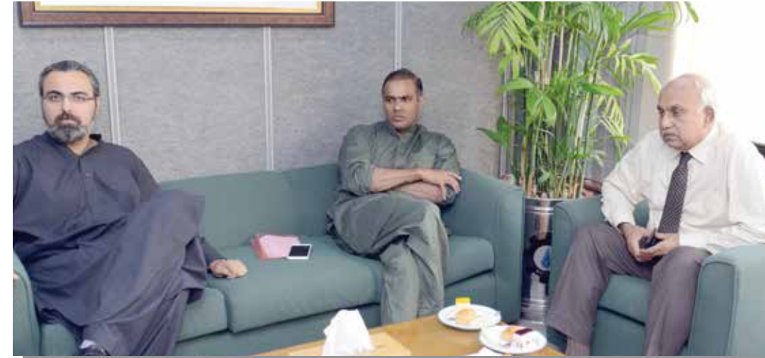
► Minister of State for Power Division Chauhdry Abid Sher Ali in a meeting with MD SNGPL Amjad Latif.