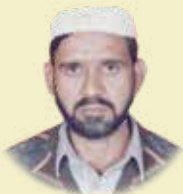
Allah Diwaya Chowkidar Transmission Section Chenab X-ING, Faisalabad (T)

SNGPL and the Editorial Team of "The Pride" are thankful to the following employees for the services they rendered. We wish all the best for their future.