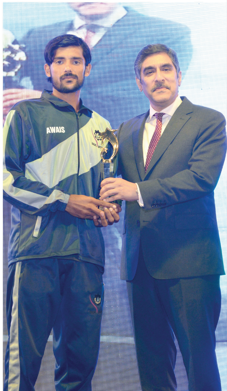
Committee and the Organizers of this Sports Gala 2023 for their skills and sportsmanship.

To cap off the exhilarating Annual Sports Gala 2023, a memorable Prize Distribution Ceremony was organized to honour and celebrate the outstanding achievements of the participants. The venue was alive with excitement as the winners, organizers, and spectators gathered to acknowledge the exceptional performances displayed throughout the event. The ceremony not only recognized the top three teams but also applauded individual players, Sports Steering