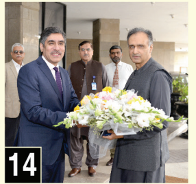
وفاتی ایڈیشنل سیکرٹری (انچارج) برائے توانائی (ٹیڈوولیم ڈویژن) کی گیس ہاؤس آمد