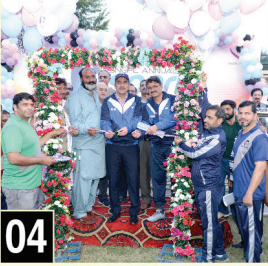
Annual Sports Gala was recently held at Lahore