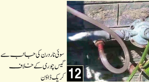
سوئی ناردرن کی جانب سے گیس چوری کے خلاف کریک ڈاؤن