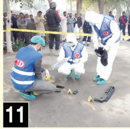
Paradigm Shift in Emergency Response Planning