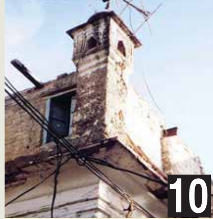
اپنی پچپان کھودینے والے سکھ مت کے تاریخی استھان کا حوالہ