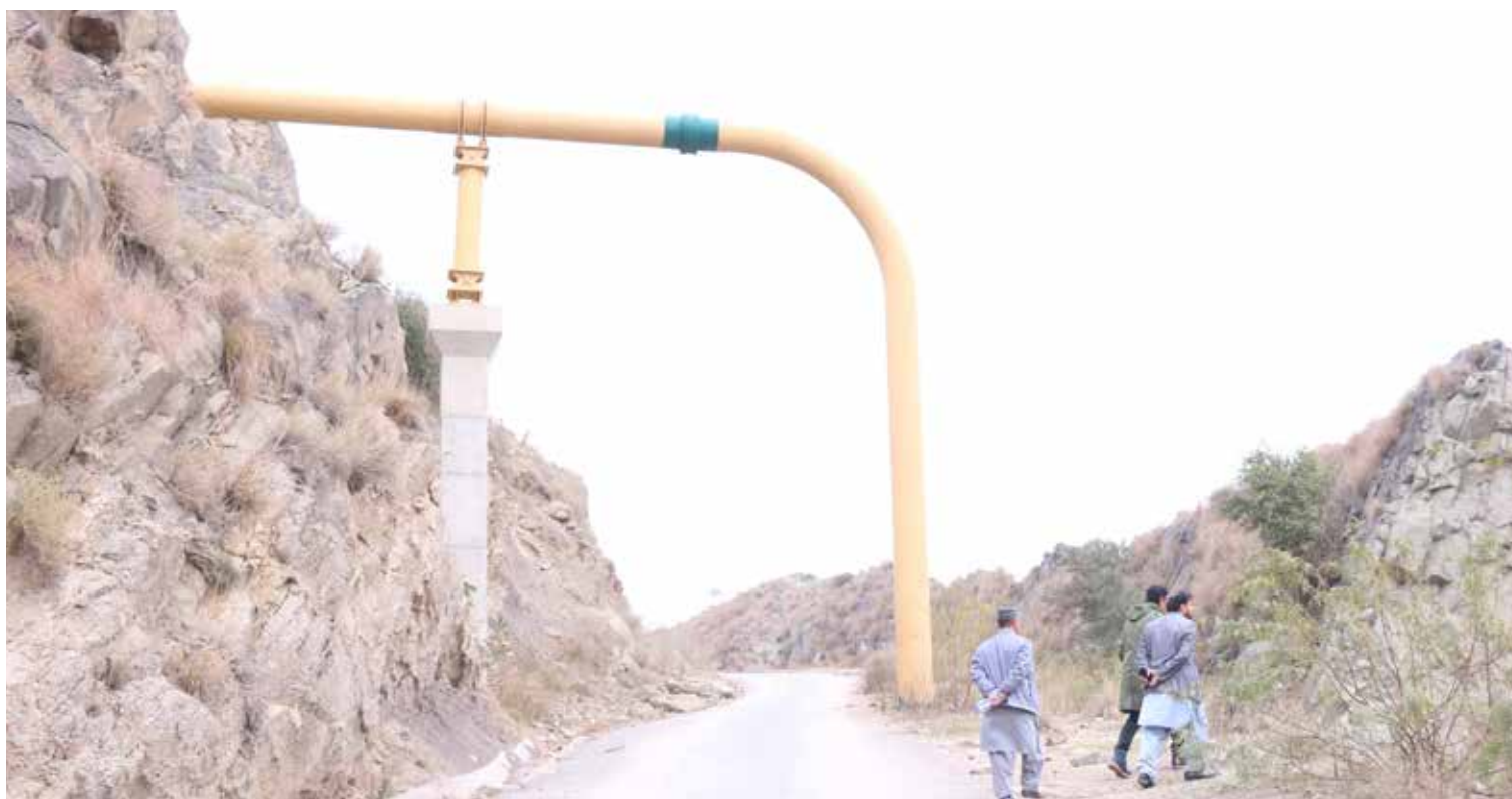
The progress on the project (as on 06.02.2020)