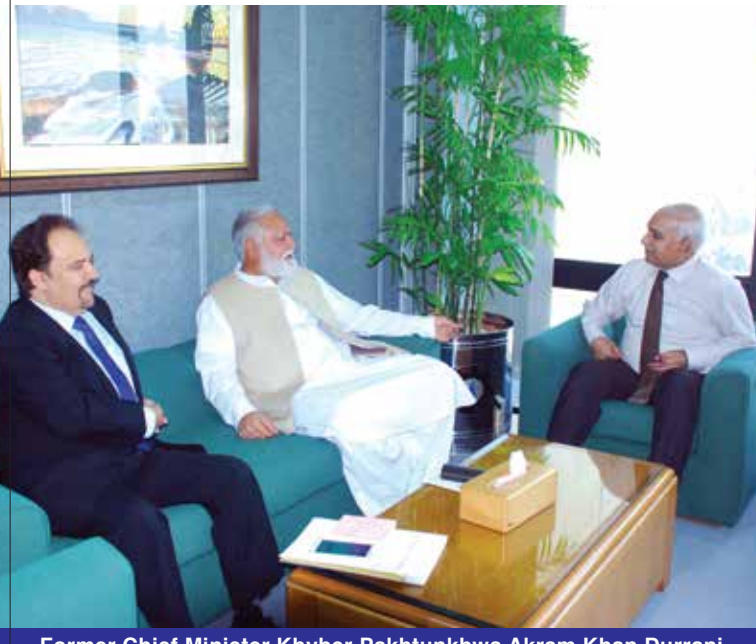
Former Chief Minister Khyber Pakhtunkhwa Akram Khan Durrani met with MD SNGPL Amjad Latif at the Head Office.