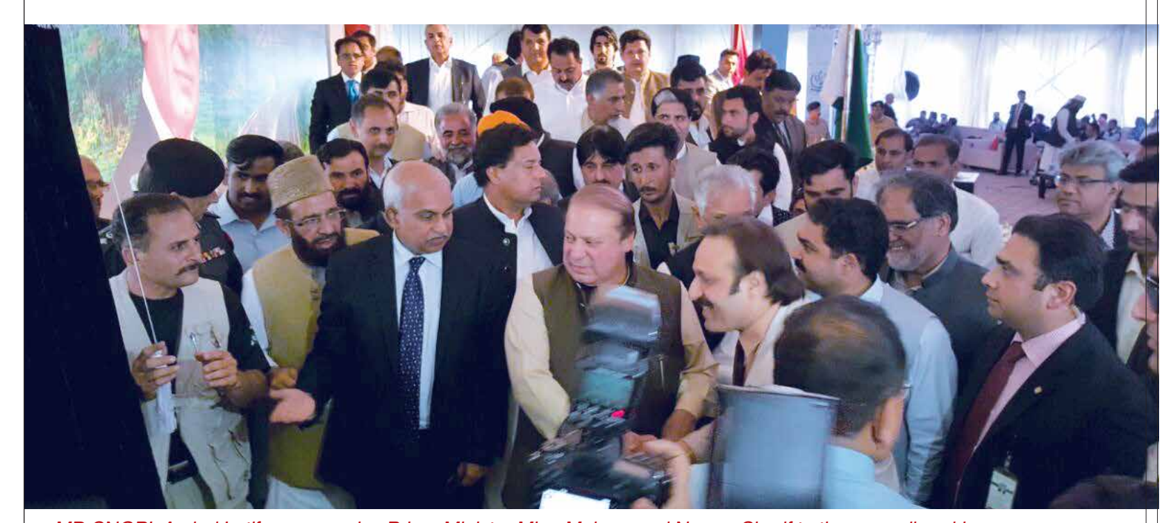
MD SNGPL Amjad Latif accompanies Prime Minister Mian Muhammad Nawaz Sharif to the groundbreaking ceremony of the Mansehra Gas Pipeline Project.

SNGPL stands with the Government of Pakistan in its vision to provide uninterrupted natural gas to every town and city of Pakistan. We share the dream of a vibrant economy which can bring prosperity to the country and the people.