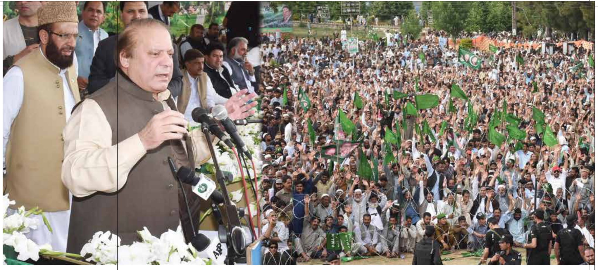
Prime Minister of Pakistan Mian Muhammad Nawaz Sharif addressing public at the groundbreaking ceremony of Mansehra Gas Pipeline Project.

onourable Prime Minister of Pakistan Mian Muhammad Nawaz Sharif, in his recent visit, to Mansehra in Khyber Pakhtunkhwa performed groundbreaking of 12-inch gas pipeline project to be laid to supply natural gas to the areas of Pakhal, Uggi, Balakot and Shinkiari.