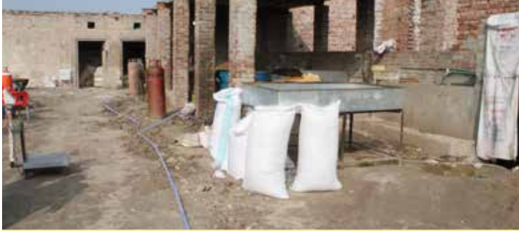
Massive operation launched in district Karrak