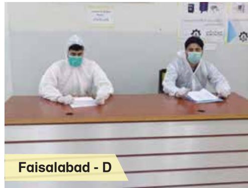
Faisalabad - D