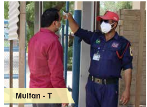
Multan - T