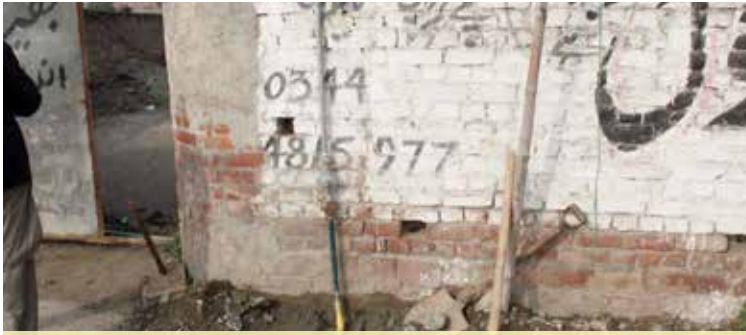
Bypass installed on service line being used in Nimko Frying Unit