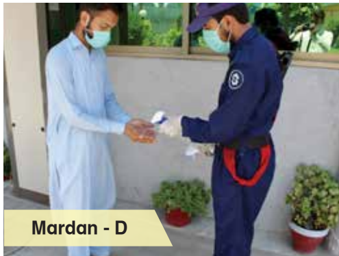
Mardan - D