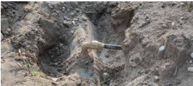
A Bypass installed on 2 gas line being used in Tandoor