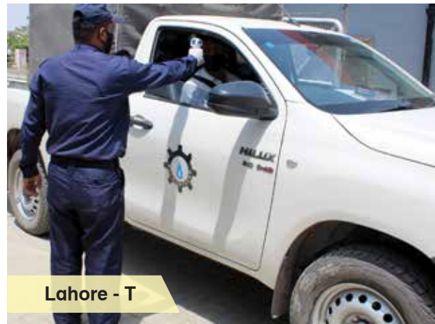
Lahore - T

Despite of shortage of anti-corona items in local markets, all necessary items for anti-corona measures were purchased and distributed across the Company on urgent basis. Efforts of Spot Purchase Committee - Head Office are commendable in this regard as they worked with zeal and dedication during the