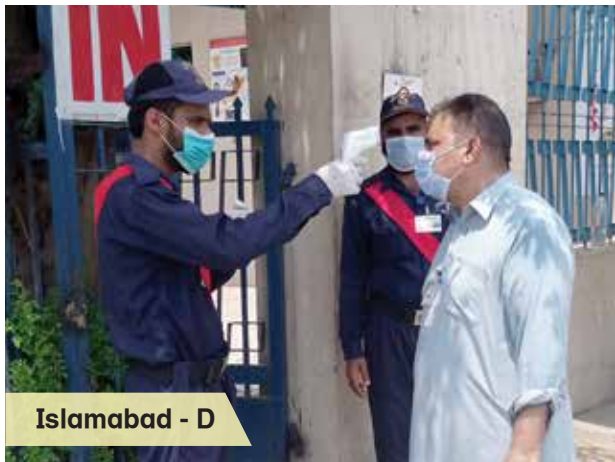
Islamabad - D