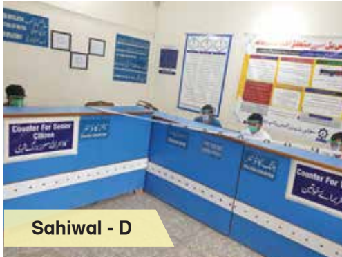
Sahiwal - D