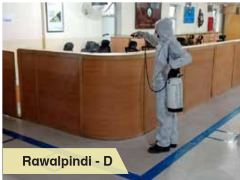
Rawalpindi - D