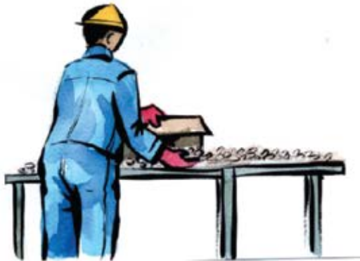
Wear gloves at all times when working on the factory floor