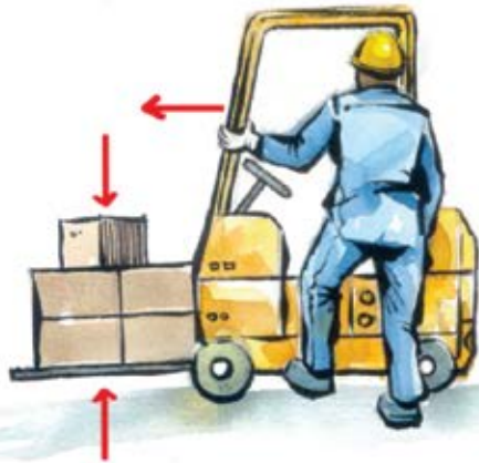
Don't block vision with load and always ensure your load is stable