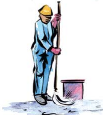
Clean spillage as soon as it occurs