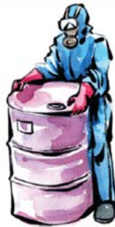
Wear your gloves, helmets, goggles and boots when moving chemicals