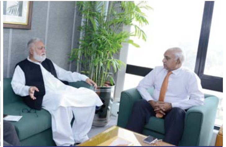
Former Chief Minister Khyber Pakhtunkhwa Akram Khan Durrani called on MD SNGPL at his office.