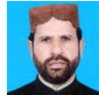
Askhab Sathi Supervisor Meter Mechanic