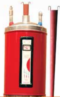
Gas Saver Cone