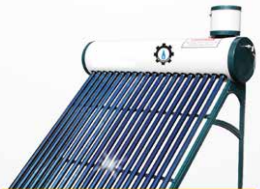
Solar Water Heater