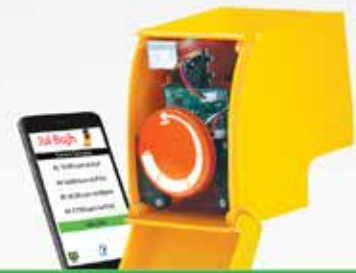
Geyser Timer Device